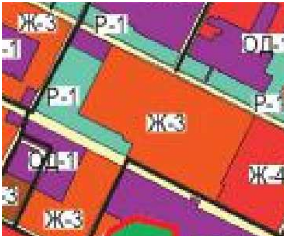
Рисунок 1. Фрагмент карты градостроительного зонирования кадастрового квартала 31:10:1003001

Фрагмент карты градостроительного зонирования представлен на рисунке 1.